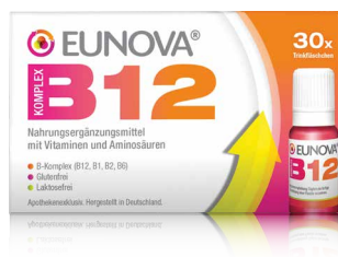
EUNOVA® B12 Komplex – Mehr als nur Vitamin B12.